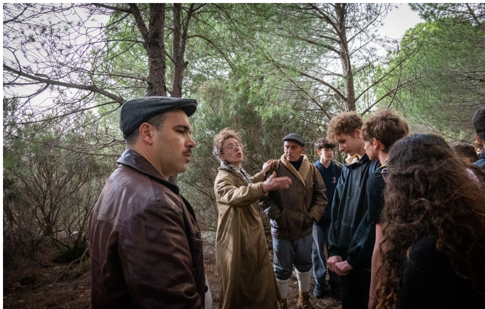
Photo prise lors de la randonnée mémorielle théâtralisée organisée à Banyuls-sur-Mer le 14 novembre 2025

Les randonnées mémorielles théâtralisées proposent une nouvelle valorisation des chemins de passage et d'évasion par les Pyrénées et permettent de faire ressortir des archives des parcours d'individus interprétés par des comédiens. En 2025, c'est notamment le profil d'Alfonsina Bueno Ester qui a été mis en avant lors des deux représentations à Banyuls-sur-Mer le 14 novembre. Exilée en France en 1939 après la défaite républicaine, Alfonsina Bueno Ester s'implique dès 1941 dans les réseaux d'évasion en France et assure des missions de liaison, de convoyage, d'hébergement et de soutien logistique au profit de la Résistance. Grâce aux recherches historiques effectuées par les RRM, son parcours a pu être mis en scène et interprété par une comédienne. Les randonnées mémorielles théâtralisées prévoient de valoriser, lorsque cela est possible, au moins une figure féminine locale par représentation.